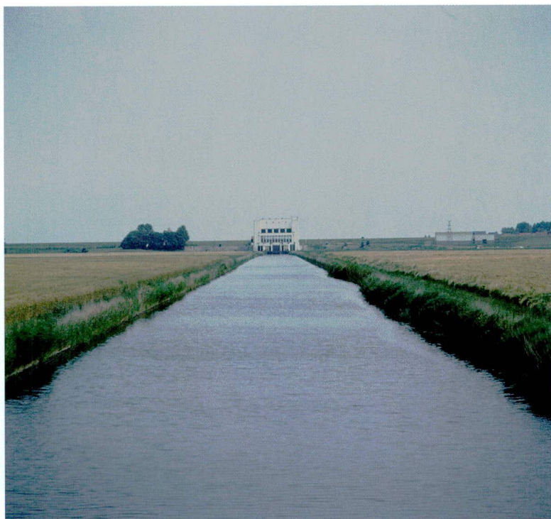
§ Dia 89.