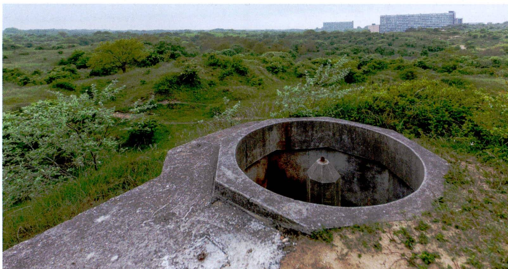
§ Een kleine bunker van het type Tobruk in de duinen bij IJmuiden.

Hoe dit contact met België is afgelopen, is niet bekend, maar toch overheerste in de eerste jaren na de oorlog het optimisme. De wederopbouw kwam op gang en er was groot vertrouwen in het herstellend vermogen van de natuur. Dat achter dit optimisme een worsteling schuilging met de letterlijke hardheid van Duits beton en juridische haarkloverij met diverse instanties blijkt wel uit de verhalen uit Voornes Duin. Toch werden de eerste jaren na de oorlog in de duinen zoveel mogelijk tastbare herinneringen aan de Duitse bezetting verwijderd.