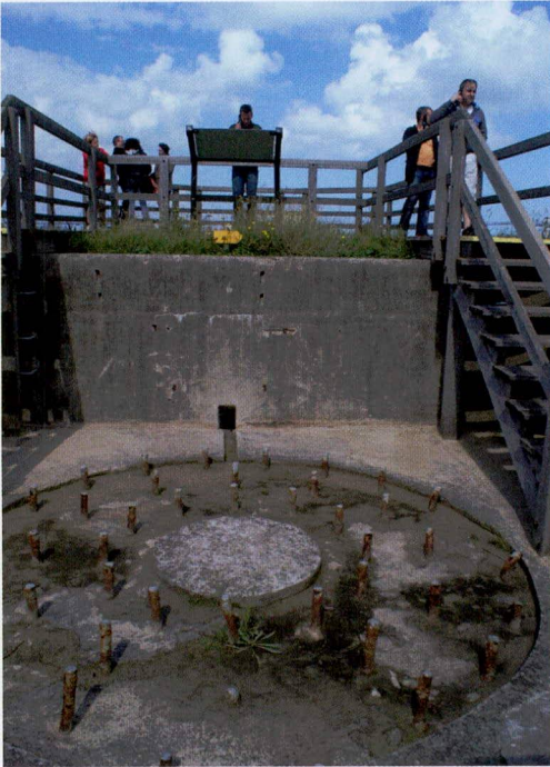
§ Domein Raversijde, België. Met een audiofoon via een route door het museale deel van het domein.

Karakteristiek voor dit scenario is dat de restanten van de Atlantikwall als elementen in het landschap zijn blijven liggen. Het achterwege laten van actief beheer kan leiden tot een romantische, ruïneachtige uitstraling. Het zuidfront van de Festung IJmuiden in het Nationaal Park Zuid-Kennemerland is een goed voorbeeld.