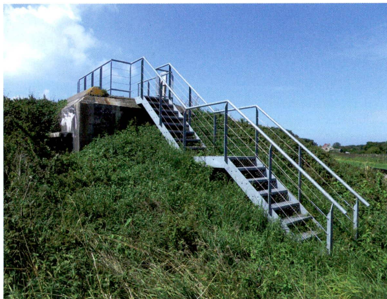
§ Duitse bunker hergebruikt als uitzichtpunt in Volgerland, Zuid-Holland.

toeval ontstaan en is nog aan bedreigingen en veranderingen onderhevig. En zoals ook geldt voor een ruïne van een gebouw zal nietsdoen onherroepelijk leiden tot verdwijnen van het object. Dat geldt niet alleen voor de betonnen werken maar zeker ook voor de 'zachte' structuren zoals loopgraven en schuttersputjes. Er moet op korte termijn nagedacht gaan worden over herstel en restauratie van de Atlantikwall-restanten, waarbij een passende restauratiefilosofie gezocht moet worden. Is de ontwikkeling van de natuur in de duinen strijdig met het behoud van de restanten uit de Tweede Wereldoorlog? Dat zal plaatselijk zeker het geval zijn. Maar in natuurgebieden waar het omstreden erfgoed nog prominent aanwezig is, zijn er eveneens volop kansen voor de terreinbeheerder om zich met dit erfgoed te profileren en daarmee aan de groeiende behoefte uit de samenleving te voldoen. Hierbij is het verstandig de restanten op (inter)nationale schaal te bekijken, zowel binnen als buiten de natuurgebieden. Het veld is juist op het gebied van de Atlantikwall zeer versnipperd, zoals de op diverse plekken ontstane kleinschalige musea laten zien. Een landelijk overzicht, bij voorkeur met