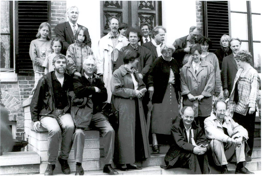
Reünie van oud-leerlingen van Van der Linden, bij hem thuis in Rozendaal, 22 juni 1997.

nen is aanvankelijk scherp bekritiseerd. In de historische geografie heeft dat verschil van inzicht geen aandacht gekregen. Daar is het heersende beeld dat het Hollandse-Utrechtse veengebied volgens het principe van de 'cope' is ontgonnen.