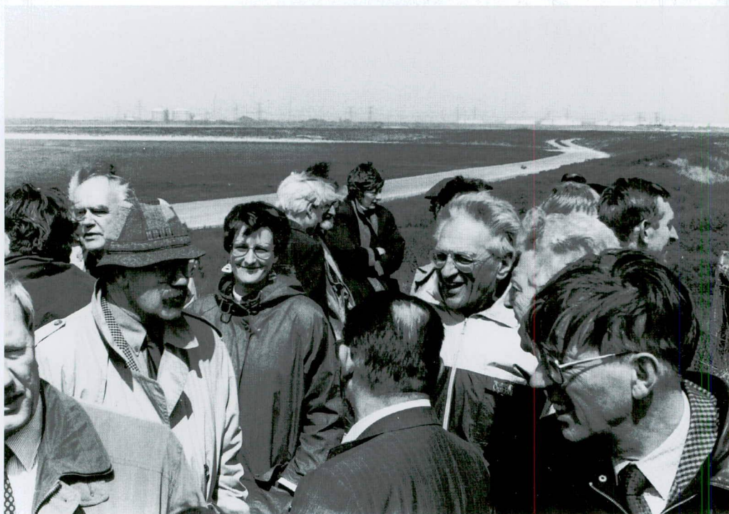
Op excursie met de Vereniging voor Waterstaatsgeschiedenis in Voorne, 9 mei 1996.

Dit verrassende inzicht was een product van de originele wijze waarop Van der Linden te werk was gegaan. Systematisch heeft hij gekeken naar het publiekrechtelijke aspect van de ontginningen. Daarbij ging het hem om de juridische vormgeving van de samenleving in de nieuwe nederzettingen en om de staatkundige veranderingen die de grootschalige ontginningen in gang hadden gezet. Die aanpak resulteerde in een fundamenteel ander beeld van de 'Grote Ontginning' en die nieuwe zienswijze liet geen ruimte voor de veronderstelde eigendomsverschuiving. Die theorie deed hij daarom af als het product van 'privaatrechtelijke vooringenomenheid'. Dat oordeel is hem niet in dank afgenomen en zijn interpretatie van begrippen als 'eigen(dom)', 'tijns', '(erf)pacht' en dergelijke in de middeleeuwse bron-