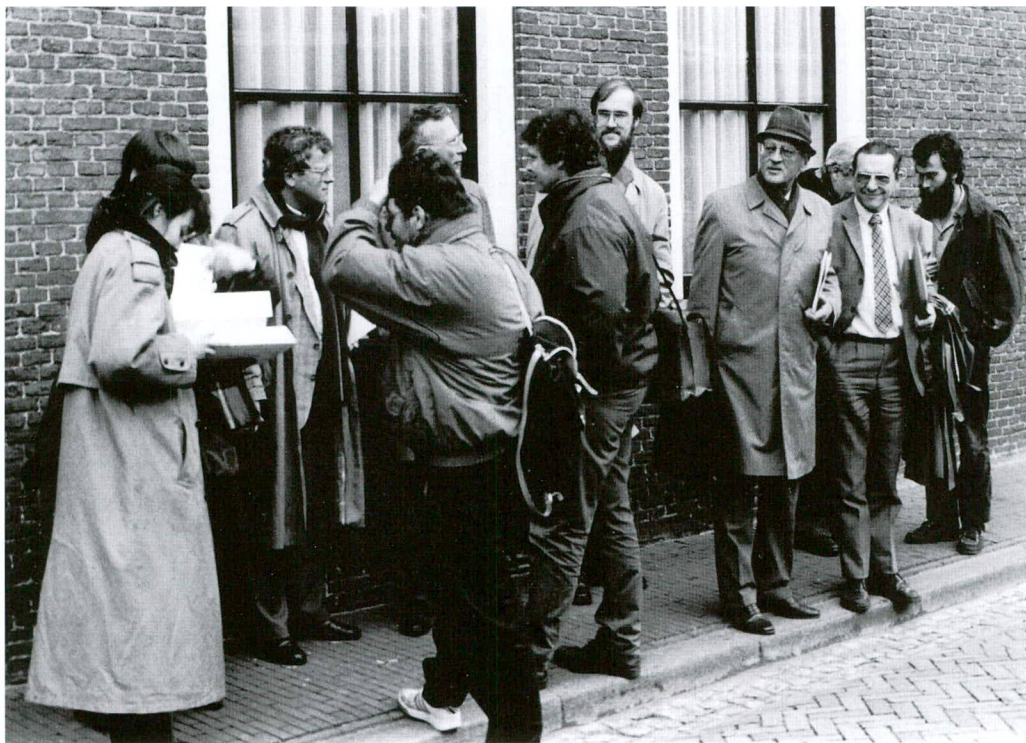
Op excursie met de Vereniging voor Waterstaatsgeschiedenis in het Land van Vollenhove, 25 april 1989.