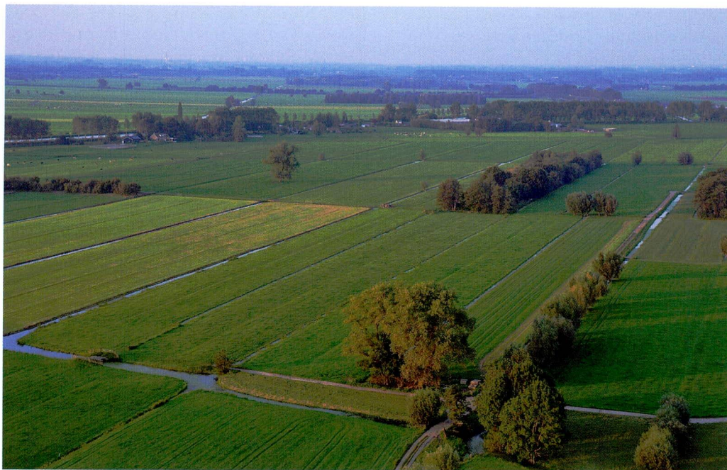
☞ Cope-landschap in de Alblasserwaard, bij Meerkerk.

standaardhoeve deel hebben uitgemaakt van het 'cope'-contract. Die maatvoering bepaalde namelijk de hoogte van de recognitietijns die de nieuwlandse gemeenschap had op te brengen en daardoor wisten de kolonisten vooraf welke last verbonden was aan het bezitsperceel dat zij wilden verwerven. In navolging van Rietschel heeft Van der Linden aangenomen dat het ontginningsblok vervolgens is opgedeeld in percelen van een 'bepaalde, gelijke grootte' (1956, p. 20). Een regelmatige strokenverkaveling is inderdaad karakteristiek voor veel ontginningsnederzettingen in het Hollands-Utrechts veengebied en elders. Het past echter niet bij het publiekrechtelijke karakter van het 'cope'-contract om aan te nemen dat daarin was vastgelegd dat de uit te zetten percelen van gelijke grootte dienden te zijn. Desgewenst konden de kolonisten een dubbele of halve hoeve verwerven en eventueel een bezitskavel van nog weer een andere omvang. De aanleg van een regelmatige strokenverkaveling was een praktische oplossing voor het toedelen