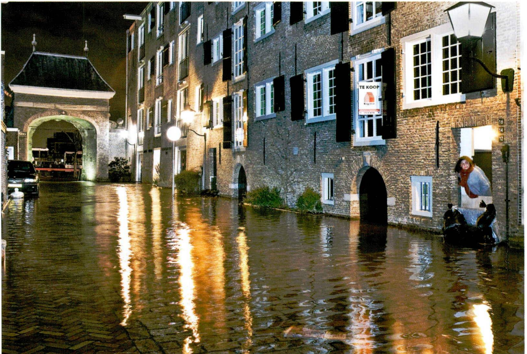
Hoog water in januari 2012 aan de Korte Engelenburgerkade in Dordrecht.