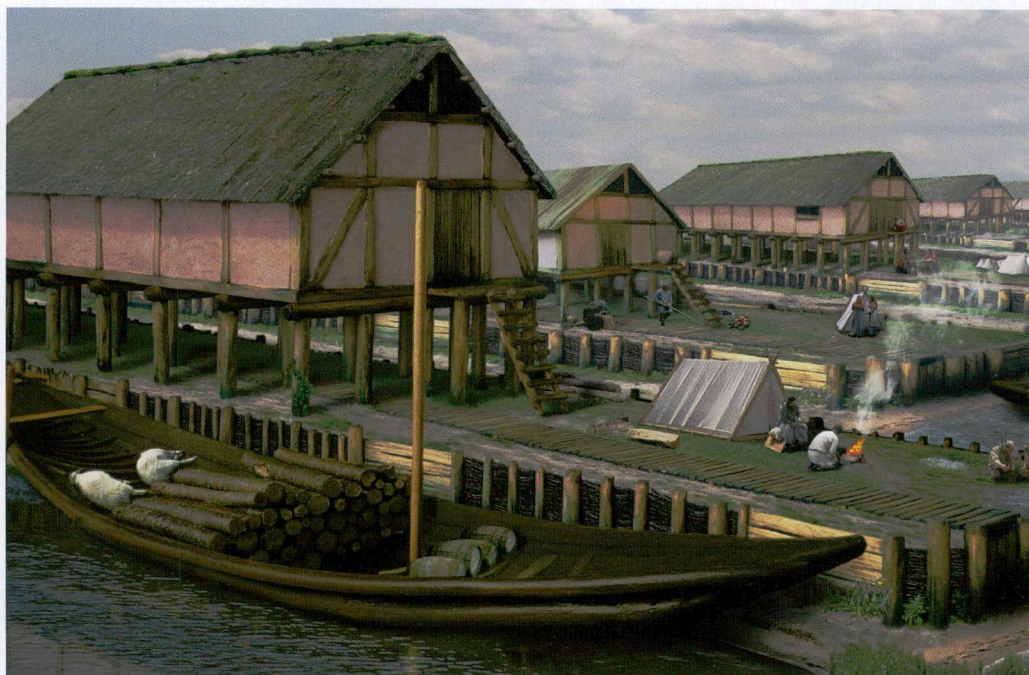
Reconstructies van ambachtshuizen en haven van Dorestad (afbeeldingen: Luit van der Tuuk).