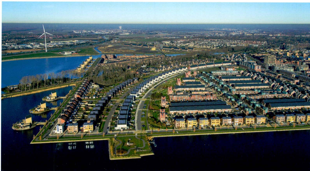
Stad van de Zon, een Vinex-wijk tussen Heerhugowaard en Alkmaar.

zeer het gebouw als vorm voorop, maar speelt de economische factor een belangrijke rol. Door de passie voor het object is dat aspect schromelijk verwaarloosd. De verankering van het gebouw in de stad ligt toch met name op het economische domein. De vastgoeddimensie van de architectuur, daar moet heel veel aan gebeuren. Die is nog nauwelijks bestudeerd.