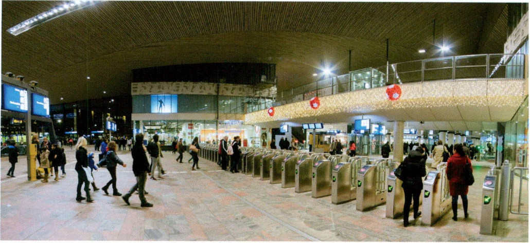
§ De nieuwe stationshal van Rotterdam Centraal.

verhaal daarachter wordt niet meer verteld. Er lijkt geen idee over de samenleving meer achter te zitten zoals in de oude nota's over de ruimtelijke ordening. Waar staan we, en waar gaan we naartoe? Het historische en sociaalwetenschappelijke onderzoek daarnaar vindt in andere gremia plaats. Het beste wat je over de toestand van de stad kunt lezen, staat in de overzichten, adviezen, nota's en aanbevelingen van plan- en advieslichamen zoals de WRR en vooral het Centraal Planbureau (CPB). Ik denk dan bijvoorbeeld aan de fraaie nota over Stad en Land uit 2010. Bij het CPB zit een aantal ambtenaren die niet onder de plak zitten van hebbelijke hoogleraren; een gezonde combinatie van vragen en onderzoekers zonder de competitieve instelling die tegenwoordig normaal is. Er worden economische mechanismen geanalyseerd die actief zijn in de vestigingspatronen, in de grondpolitiek, de wetten die de ruimtelijke regimes regeren, de fundamentals van de ruimtelijke ordening. Maar de conclusies van die stukken zijn niet gekoppeld aan een specifiek ruimtelijke visie, laat staan aan scenario's die bedoeld zijn om dingen te veranderen. Een van de conclusies van het CPB is bijvoorbeeld dat de afstemming tussen verstedelijking en infrastructuur gebrekkig is. We