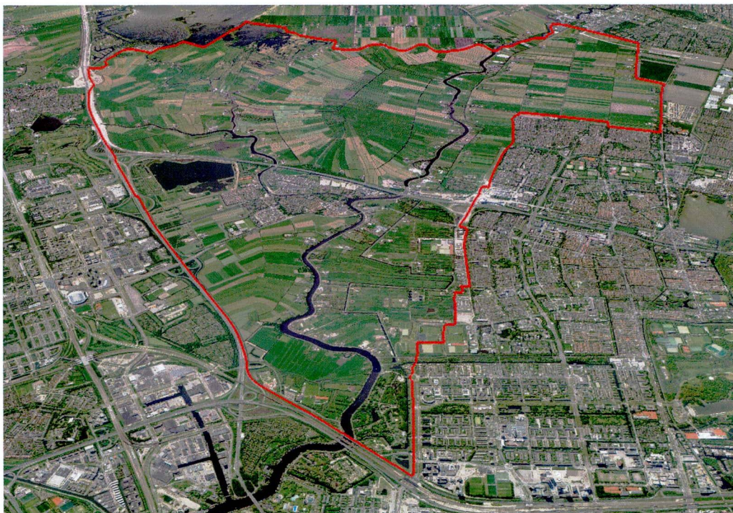
Het Amstelland in vogelvlucht (Kees van Tilburg).