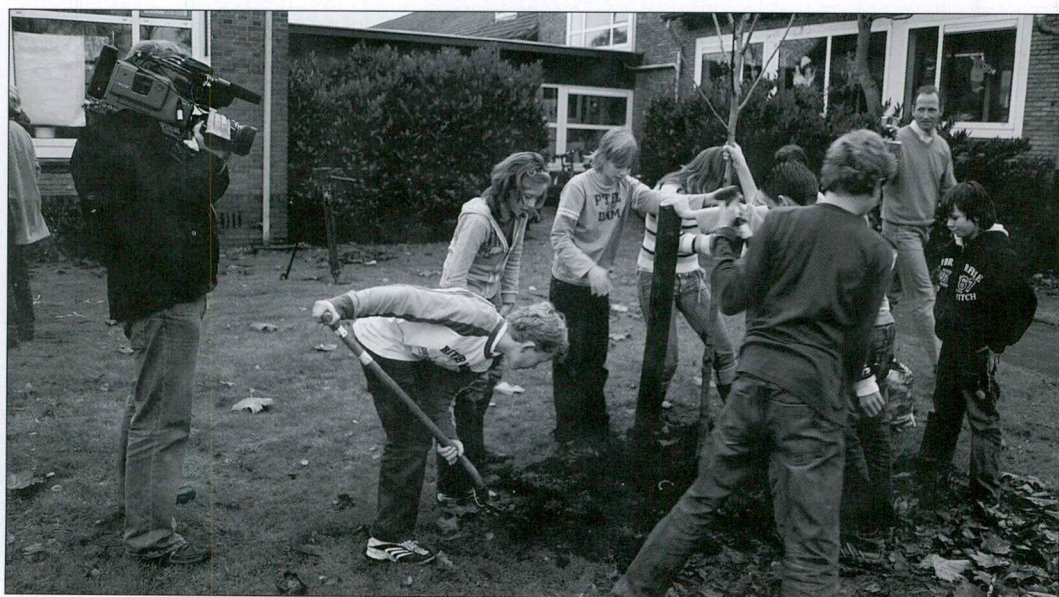
Scholieren planten een klimaatbosje (Foto Wanne Roetemeijer).

Bij alle klimaatbosjes, die vaak op openbare plaatsen worden geplant, zoals bij scholen, kinderboerderijen of stadhuisen, staat een speciaal ontworpen herkenningsteken, dat niet alleen uitlegt waar het klimaatbosje voor staat, maar het publiek ook oproept om bewust bij te dragen aan de vermindering van CO 2 .