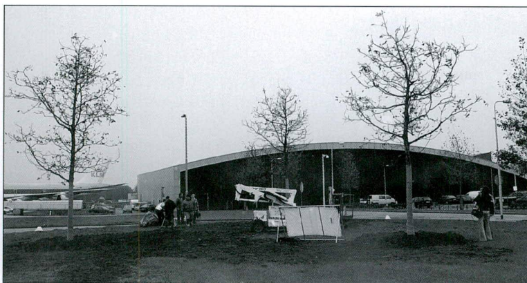
Het allereerste klimaatbosje is geplant bij Vliegveld Lelystad.

gemaakt. Het is namelijk een echte gebruiksbom. Ouders kunnen samen met hun kinderen de walnoten rapen, en zo het verhaal achter de bosjes op een aansprekende manier aan hun kinderen doorgeven. Walnotenbomen zijn duurzaam, in de zin dat het hout langzaam groeit en na de kap vaak wordt verwerkt in waardevolle meubels, zodat ook na de kap het