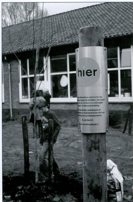
Herkenningsteken zoals geplaatst wordt bij een klimaatbosje