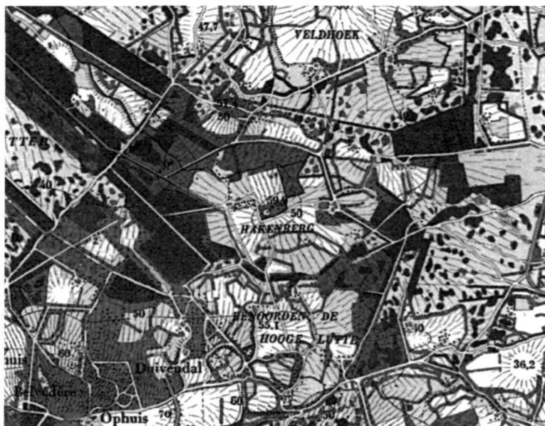
Buitenplaats De Hakenberg op de stuwwallen ten noordoosten van Oldenzaal (Chromotopografische Atlas Overijssel, 1: 25.000, c. 1900).

leggen, bijvoorbeeld bij De Hooge Boekel (nr. 51), Paaschberg (nr. 78) en Hakenberg (nr. 80). Echter, bestaande studies hebben wellicht te veel eenzijdig belang gehecht aan deze motivatie voor locatiekeuze. Elke bestudering van nieuwe buitenplaatsontwikkelingen in Twente moet rekening houden met beschikbaarheid van land en veranderingen in de grondpolitiek zoals de verdeling van de markengronden.