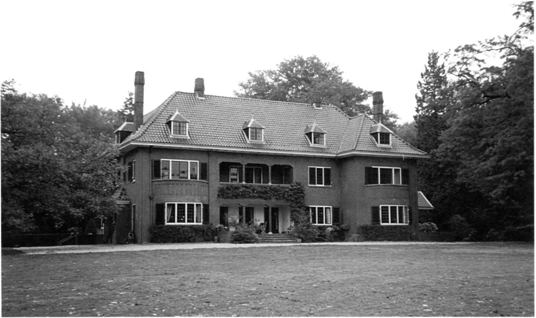
Landgoed De Hulst nabij Oldenzaal.

In 1898 had bijvoorbeeld de familie Gelderman het 17e-eeuwse landgoed De Hulst gekocht van de familie Kistemaker om het vervolgens in 1916 te verdelen in twee kleinere buitenplaatsen: De Hulst en Scholtenhaer 8 . In andere gevallen werden bestaande tuinhuisen en theekoepels door de eigenaren vervangen door nieuwe landhuizen, bijvoorbeeld de Hakenberg van de familie Blijdenstein. Aan het einde van de 19e eeuw had de familie ten oosten van Oldenzaal enkele hectare land gekocht (op een hoogte van 55 meter) waarop zij in 1903 een kleine theekoepel bouwden (Goïnga, 1999, p. 134). Negen jaar later gaf de familie aan Pieter Wattez de opdracht om de tuinen te ontwerpen, doch een landhuis werd pas in 1927 gebouwd. Tegen die tijd hadden de Blijdensteins hun landbezit vergroot tot 66 hectare 9 . Andere voorbeelden waarbij een theekoepel, tuinhuis of jachthuis later vervangen werd door een landhuis zijn Beernink (1893), Boerskotten (1860; landhuis in 1927), Bonenkamp