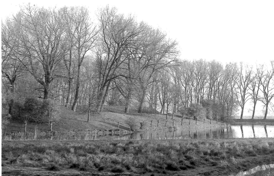
Fort Nigtevecht, een van de forten van de Stelling van Amsterdam.

roemd de aanwezigheid van de rivier de Amstel en het contrast met de stad die het gebied aan twee zijden flankeert. Daarbij werd opgemerkt dat dit contrast wel beter en sterker vormgegeven kan worden, vooral langs de randen van Amstelland en dat het landschap als geheel ook wat meer allure zou kunnen krijgen. Er zijn in ieder geval een aantal polderlandschappen die open moeten blijven. In deze polders krijgt het agrarisch gebruik (rundveehouderij) het primaat. Het landschap leesbaar houden, zowel aardkundig als cultuurhistorisch met zoveel mogelijk behoud of ontwikkeling van bijpassende natuur is het doel. Er moeten derhalve oplossingen worden gezocht als door te ongunstige toekomstperspectieven bijna geen boeren meer overblijven. De voormalige inundatievelden van de Stelling van Amsterdam zijn aangegeven als aanknopingspunt voor waterberging en natuur-