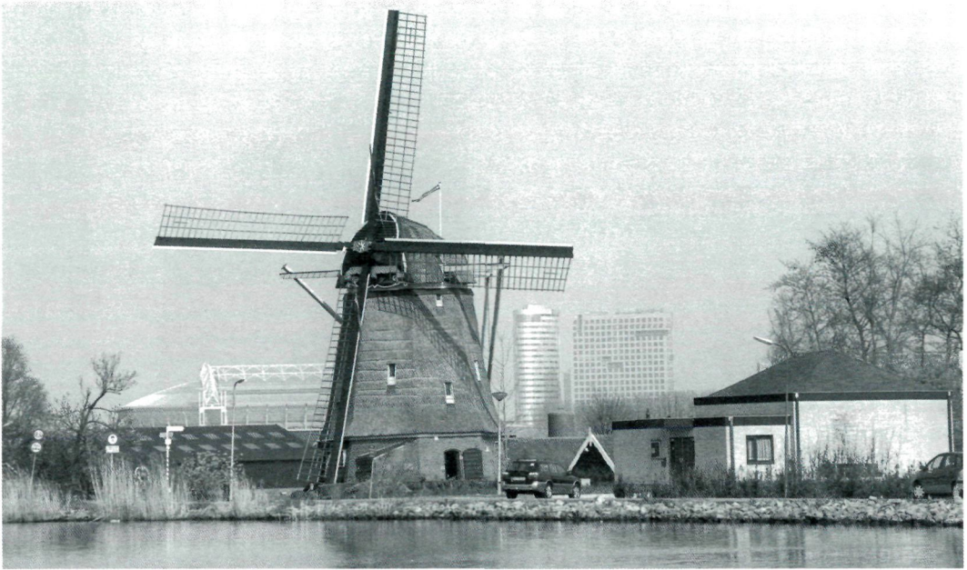
De Amstel met daarachter de skyline van Amsterdam-Zuid-Oost.

zuiden vormen de rivier de Waver langs de polder de Ronde Hoep en de rivier de Winkel richting Abcoude de grens. De historie van het gebied hangt nauw samen met die van de stad Amsterdam. De invloed van Amsterdam is tot op de dag van vandaag merkbaar, onder meer als uitloopegebied voor de recreërende Amsterdammers. We gaan op deze plaats niet uitvoerig de cultuurhistorie van het gebied beschrijven, zie daarvoor bijvoorbeeld Raap (2003) en het recent verschenen werk van Haartsen en Brand (2005), maar beperken ons tot de hoofdlijnen.