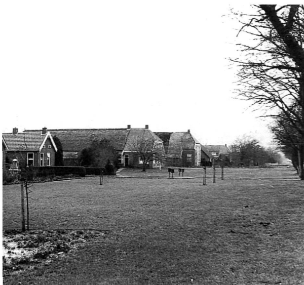
Gedempte Noorderhoofddiep met boerderijen en arbeiderswoningen.

deze exploitatiewijze veel kapitaal vereiste, waren er uiteindelijk maar weinig oorspronkelijke waardeelhouders in staat en bereid in deze ontginning te participeren. Zij trokken zich daarom terug. Zij maakten plaats voor investeerders van buitenaf.