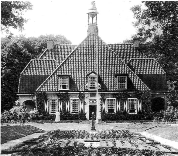
Prentbriefkaart van voor 1934 met de afbeelding van het landhuis en verdiepte geometrische tuin van De Slotplaats.

Nu het ontwerp uit 1922 bekend was, bleef de vraag hoeveel van de plannen was gerealiseerd. Oude prentbriefkaarten boden hierbij een goede ondersteuning. Uit zowel de collectie van de Provinciale Bibliotheek Friesland als de ansichtkaartencollectie van de afdeling topografie van het Rijksbureau voor Kunsthistorische Documentatie te Den Haag kwamen prentbriefkaarten van De Slotplaats tevoorschijn. Deze prentbriefkaarten dragen poststempels tussen de jaren dertig en zeventig van de 20e eeuw. De meeste informatie geeft een prentbriefkaart die in 1934 is verstuurd, waarop de verdiepte voortuin goed is te zien. Die tuin is gevuld met bloemperken, terwijl aan weerszijden lage boompjes zijn geplant. Het lijken jonge plantjes en het hagenpatroon van het ontwerp uit 1922 is op de foto niet goed herkenbaar. Mogelijk is de tuin in de jaren der-