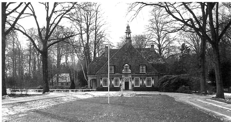
Landhuis De Slotplaats, huidige situatie.

tig versoberd ten opzichte van de aanleg in 1922. Tegenwoordig zijn van deze aanleg alleen nog het verdiepte gazon en de trappen aanwezig. Op een andere prentbriefkaart uit de jaren dertig of veertig vallen de witte hekken en het bruggetje in de zichtas op. De hekken en het bruggetje zijn nu verdwenen.