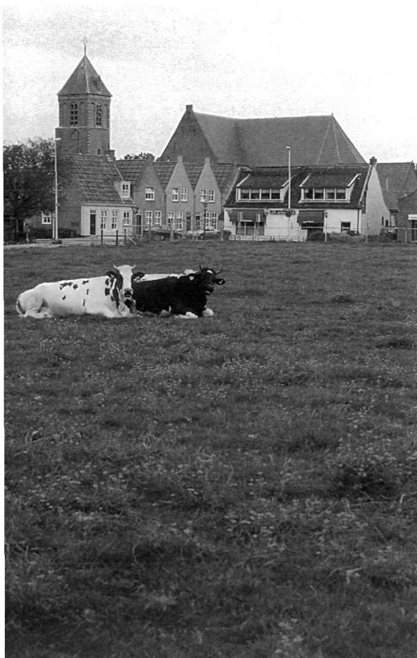
Gezicht op Nieuw-Helvoet en de Kerck-Houck.

van het kadaster. Vanaf dat moment is de grondregistratie in Nederland uniform en zijn de veldboeken overbodig geworden. Naast het Kaartboek van Voorne bezit het Streekarchief Voorne-Putten en Rozenburg een kaartboek van de polders van Nieuw-Helvoet en de Quack. Het is een klein boekje, 16 x 20 cm met 19 bladen en ongekleurde