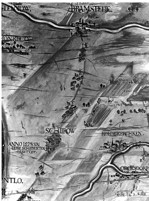
Daniel Frese, 'Die Landtafel der Grafschaft Holstein-Pinneberg' uit 1588. Detail van een 'vogelvluchtopname' van een deel van de weg tussen Bramstedt en Wedel, nabij Hamburg. Schloß Bückeberg, Duitsland.

Garanderen dat de opgegeven route exact zou worden gevolgd konden ossenhandelaars nooit. Dat blijkt uit de opmerking op de afgebeelde lijst dat, indien van de route werd afgeweken, dit kwam omdat Jutland groot en wijd en zijd versprikt is, onderweeg de voerplaatse zijn daar 't beste hooij is en omdat de handelaars en drijvers erop moesten toezien dat het vijlig en secuur was, sonder welk geen ossen passeeren kunnen. De keuze voor alternatieve routes was niet willekeurig, want langs de hoofdroutes had zich een infrastructuur ontwikkeld van herbergen voor kooplieden en drijvers, kralen voor het vee, stalling voor de paarden, markten, veerdiensten en tolplaatsen, terwijl boeren uit de omgeving hooi en stro leverden voor de passerende dieren.