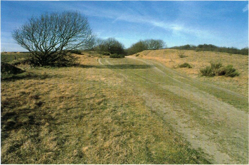
De ossenweg van 'Kropper Busch' nabij Sorgbrück in Duitsland.

Daarin werd niet langs alle wegen voorzien. In Denemarken en Sleeswijk-Holstein is uitgebreid onderzoek gedaan naar de deels intact gebleven ossenwegen. In Sleeswijk-Holstein is de belangstelling voor de ossenweg als archeologisch monument mede te danken aan de actieve inzet van de Arbeitsgemeinschaft Ochsenweg . Over het ossentransport via routes tussen de Elbe en de Nederlandse grens is minder bekend. Van een aantal Nederlandse wegen weten we zeker dat zij mede bestemd waren voor ossentransport. Zo werden in 1736 en 1737 de te volgen 'routes en Heere Baanen' voor goederen- en veevervoer door Overijssel, Gelderland, Hol-