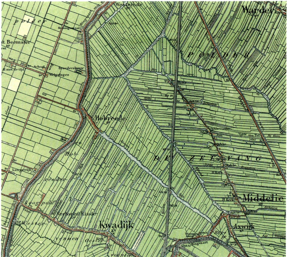
Fragment van het Noordhollands veengebied. Uitsnede uit de Chromotopografische kaart 1:25.000, blad 296, opname 1906.

gebieden van Oost- en Westzaan en dat de ontginningsbasis van deze nederzettingen langs de Twiskes gezocht moet worden. In gebieden met een regelmatig doorlopende strokenverkaveling, zoals de Zaanstreek, is het moeilijk om te bepalen wat de ontginningsbasis en wat eertijds de achtergrens is geweest. In dergelijke gevallen kunnen ver-