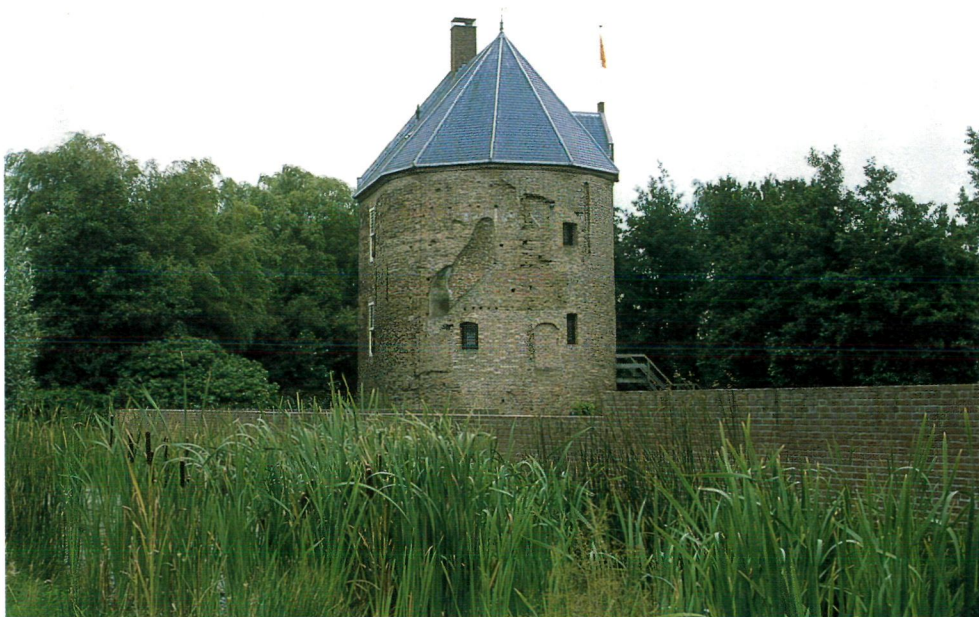
Dever vanuit het westen. Op de voorgrond muurwerk van de deels gerestaureerde voorburcht (2001).

raadschap Rijnland te Leiden (OAR), het gemeentearchief Leiden en het Oudarchief Lisse te Lisse.