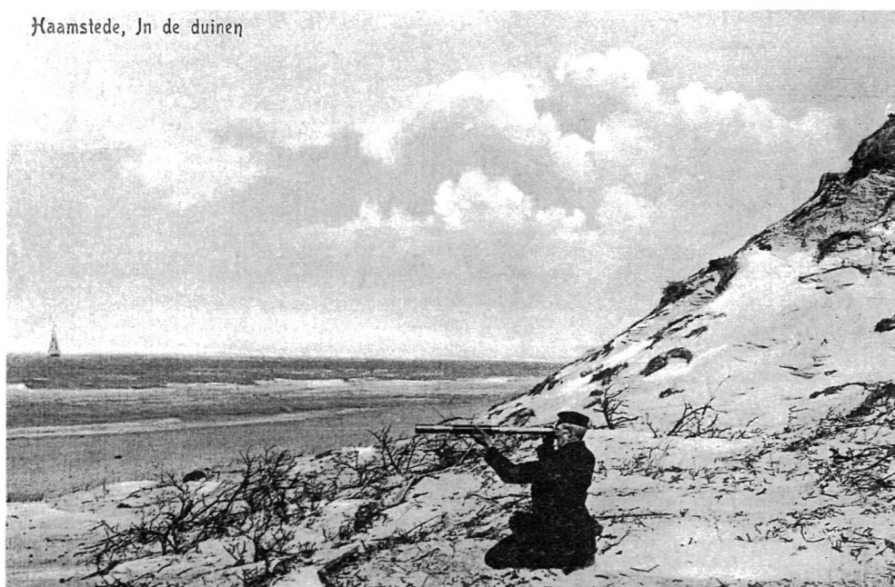
Strand en zeereep bij het Suikergat (7).