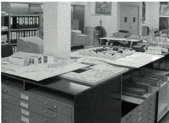
Diverse werkmaquettes van ontwerp bureau Paul van Beek Landschappen.

niet meer geassocieerd worden naar bestuursgebieden (geografisch), maar naar handelingen, gebaseerd op de werkzaamheden van de overheid op een specifiek beleidsterrein. Veel archieven zijn of worden onderworpen aan de herselectie. Voor onderzoekers betekent het dat, voor zover het gewenste materiaal al geselecteerd is, zij moeten weten tot welke 'goedkeuringshandeling' dit behoort om het te kunnen traceren. Daarnaast is de effectiviteit van het oude en het nieuwe selectie- en archiveringssysteem zeer afhankelijk van de personen die ze toepassen. Naarmate die beter ingevoerd zijn in de materie kan er adequater geselecteerd worden. Waar ontwerper en archiefmedewerker samen de selectie bepalen, zoals bij Rijkswaterstaat Limburg, is het resultaat naar beider oordeel positief. Een andere mogelijkheid is het aantrekken van een inhoudelijk ingevoerde onderzoeker voor de selectie 4 . De samenwerking maakt archivering op zowel juridische als inhoudelijke gronden