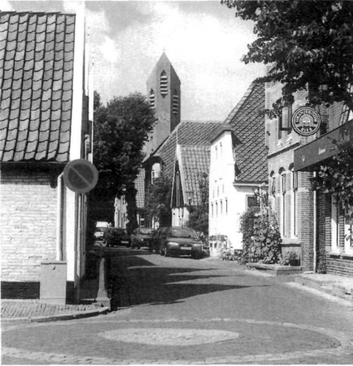
Dorpsgezicht De Waal, Texel.

scape. Finally, the sharp increase of recreation and tourism after World War II had an important impact on the landscape too.