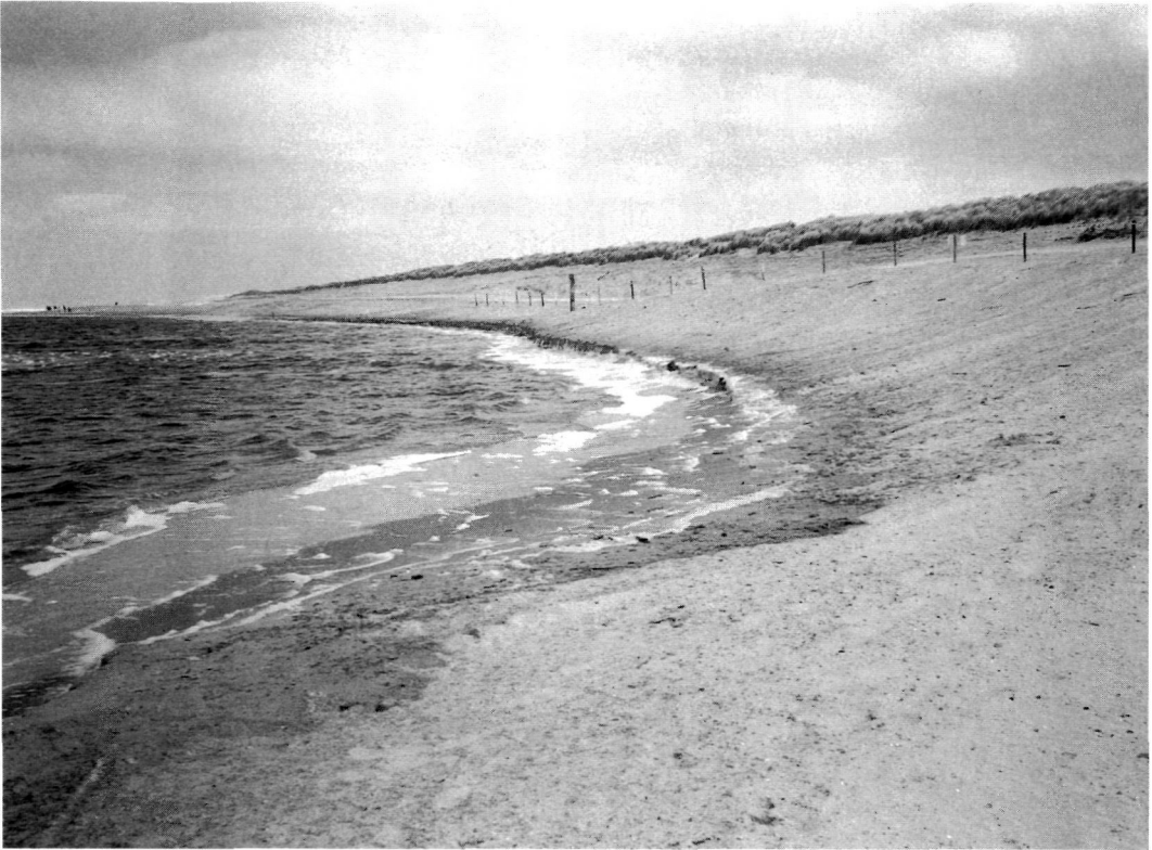
Ameland: duinafslag nabij het Ballumerstrand.

Bij de vastlegging van de duinen verdwenen de vroegere duinontginningen. De huidige ontginningen op Terschelling en Vlieland dateren uit de eerste helft van de 20e eeuw en dienden, bij de afschaffing van het recht om vee vrij in de duinen te laten weiden, ter compensatie voor het verlies van deze weidegrond.