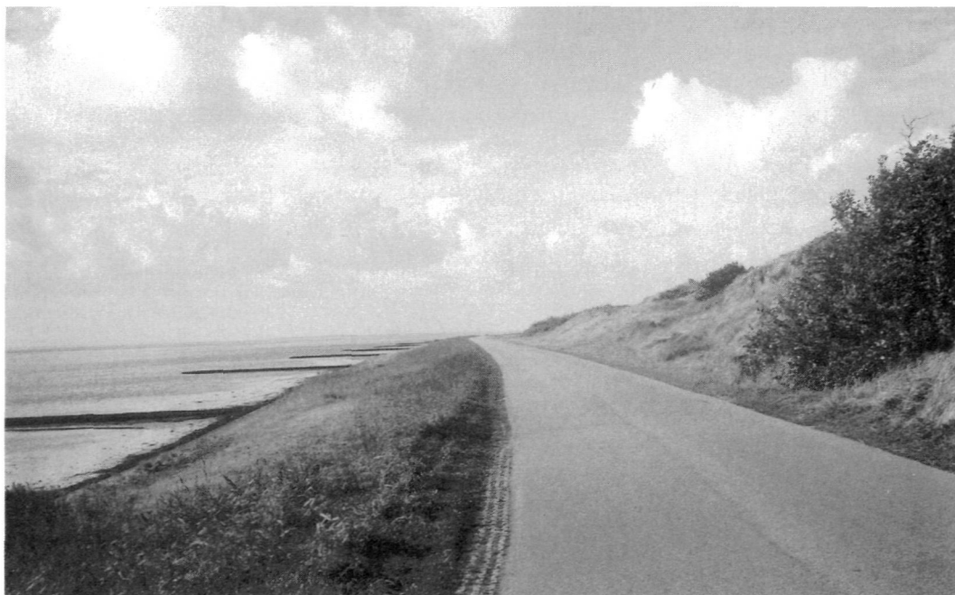
Tuinwal op Texel.