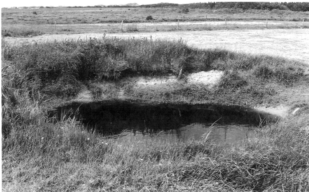
Terschelling: dobbe op de Grië.

en kwelders. Het cultuurland bestaat uit strandwallen, vroeg- of laat-bedijkte polders en op Texel bovendien uit pleistocene gronden. Door de ruilverkavelingen zijn de verschillende landschapsdelen van het cultuurgebied op elkaar gaan lijken. Vlieland heeft alleen maar duinen, het beeld hiervan wijkt niet af van dat van de andere eilanden. Wieringen heeft geen duinen: het cultuurland vertoont sterke overeenkomst met het oude land van Texel. De duingebieden, voor zover niet aangetast door de bouw van recreatiewoningen en voorzieningen voor toeristen, zijn, om het populair uit te drukken, puur natuur. Het cultuurlandschap van het poldergebied kon een eeuw geleden misschien nog arcadisch worden genoemd, nu is dat niet meer het geval. Niettemin heeft het een sterk landelijk karakter behouden.