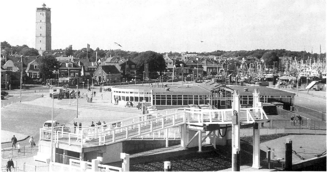
Haven van West-Terschelling.

per vierkante kilometer in het duin-, strand- en kweldergebied 4 meetpunten zijn aangehouden. In de tabel zijn deze gebieden aangeduid als duingebied . In het overige gebied, dat grotendeels cultuurland is, zijn 16 meetpunten per vierkante kilometer aangehouden. Alhoewel de vlag de lading niet helemaal dekt, is dit gebied aangeduid als poldergebied . De tabel is een samenvatting van de onderzoeksresultaten. Tijdens het onderzoek zijn van meer karakteristieken de waarden bepaald en gedetailleerder uitgewerkt.