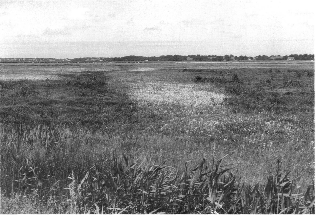
Terschelling: hooilanden in de polder.

Duinen. Op Terschelling ligt bovendien een stelsel van strandwallen geïsoleerd in het poldergebied. Wieringen is een buitenbeentje: er zijn geen duinen of strandwallen.