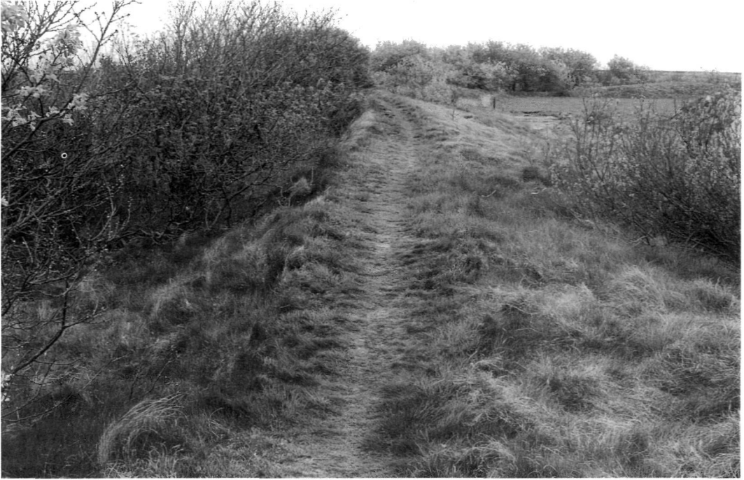
Ameland: restant van de oude miedendijkjes.

klein. Bij de ruilverkaveling in 1916 van de Balker Mieden – de eerste ruilverkaveling in Nederland, bovendien op vrijwillige basis – bedroeg het aantal percelen op een oppervlakte van 190 hectare 3.659; een gemiddelde perceelsgrootte van 5,2 are. Enkele jaren later volgde de ruilverkaveling van de Hollumer Mieden. Bij deze vroege ruilverkavelingen bleven de oorspronkelijke miedendijkjes gespaard. Bij de ruilverkavelingen tussen 1940 en 1970 verdwenen ze goeddeels. Er zijn nu nog maar enkele stukjes van de oude dijken terug te vinden. Ook op Wieringen werd het oude landschap sterk aangetast door de ruilverkaveling. Op een paar na zijn alle tuinwallen er verdwenen.