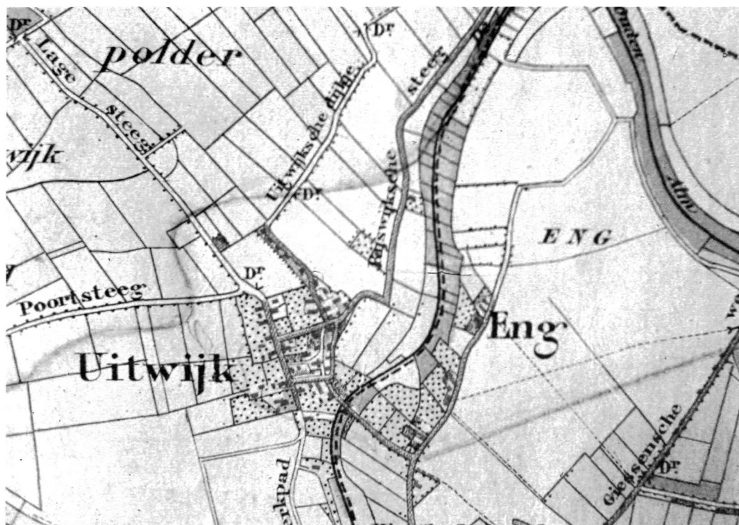
Uitwijk en Eng op de Chromotopographische Kaart (1888).

is sprake van de porte van Woudrichem (Korteweg, 1948, nrs. 25 en 43). Woudrichem is dus in de 13e eeuw een handelsplaats, maar we weten niet wanneer die functie is ontstaan. Van grote betekenis is het nooit geworden.