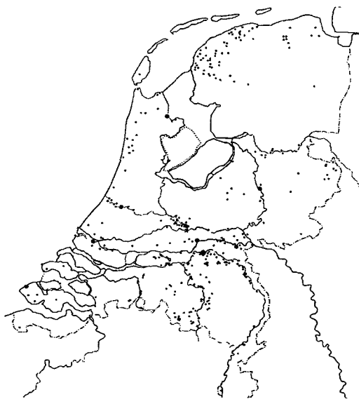
De verspreiding van Karolingisch draaischijfaardewerk in Nederland (naar Van Es en Verwers, 1994).

Van het Woudrichem uit de Vroege Middeleeuwen is helaas vrijwel niets bekend. De oudste schriftelijke vermelding is waarschijnlijk een aantekening in een goederenlijst van de abdij te Werden uit de 10e of de 11e eeuw. Vervolgens is er een Utrechtse oorkonde uit 1178, waarin een conflict over de tienden van Woudrichem wordt opgelost. Dit is de eerste aanwijzing voor het bestaan van een parochiekerk. Een handvest voor de stad ontvangt Woudrichem in 1356 (Korteweg, 1948, nr. 109). Evenwel, al lang voor die tijd wordt in een oorkonde van de graaf van Holland uit 1283 gesproken van de poorters van Woudrichem, die op bepaalde dagen tolvrijheid hebben, en van de jaarmarkt te Woudrichem. In een oorkonde van 1307 van de Hollandse graaf