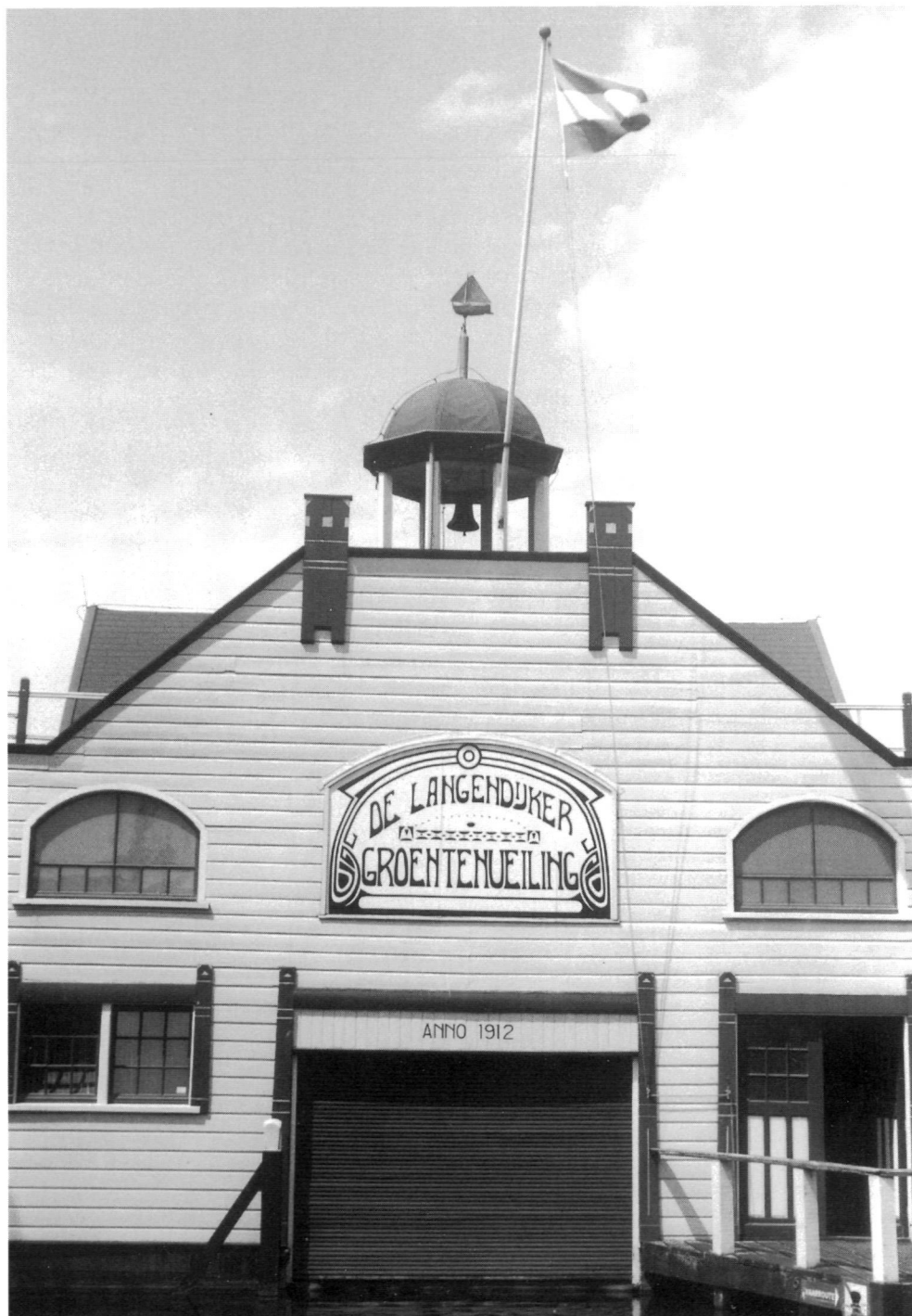
Museum Broeker Veiling.