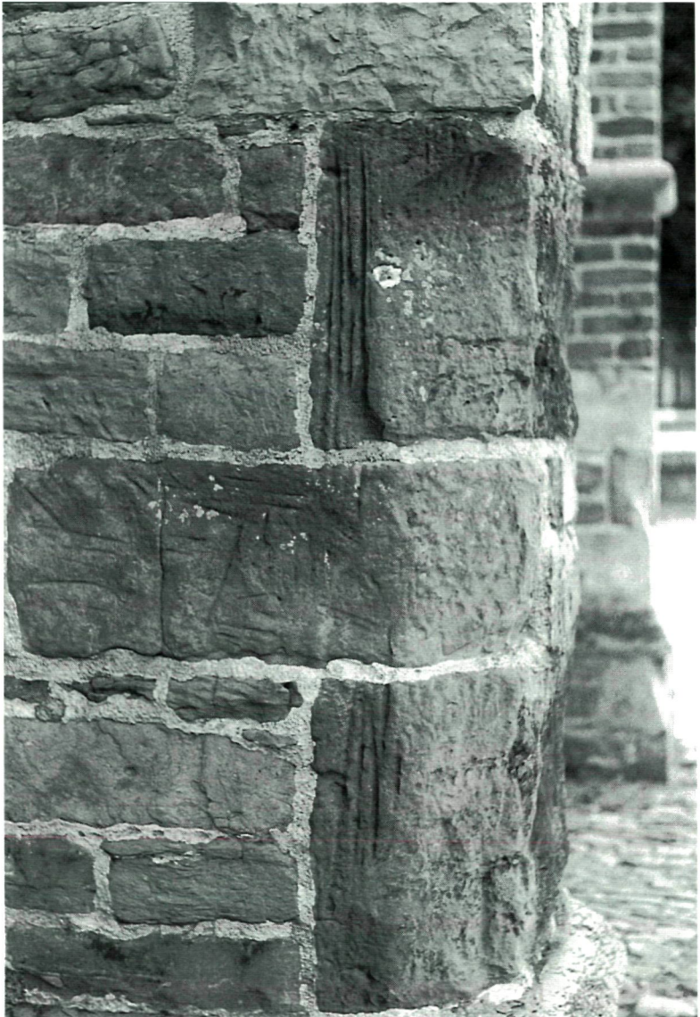
1. St. Bavo te Aardenburg.

gleuven bekend, namelijk uit de al eerder genoemde kerk van Termunten, in de St. Bonifatius van Wehe (een grafdeksel dat later als altaarsteen is gebruikt en nog later diende als stoepsteen voor de westelijke toreningang) en een grafdeksel in het voormalig Kruisherenklooster uit circa 1500 van Ter Apel.