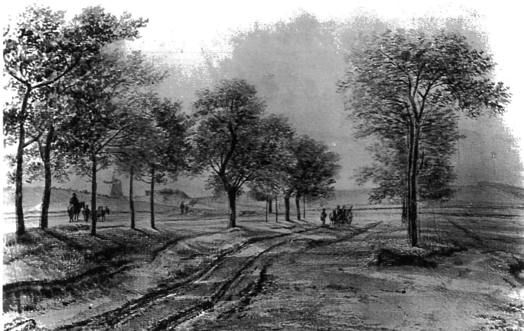
Gezicht op Hilversum en de Korenmolen aan de Vaartweg (Moleneind) in 1818. Naar een tekening van Jan van Ravenswaay (1789–1869).

Hoe ging die invoer van het kadaster in de praktijk? De situatie die het Franse bestuur achterliet zal hierop van invloed zijn geweest. Ten aanzien van de stand van zaken bij de invoering van het kadaster bestonden er grote regionale verschillen. Er zijn aanwijzingen dat men in sommige delen van het land al beschikte over opmetingen en de daarbij behorende tafels met eigenaren van een vroeger datum. Ook in Noord-Holland moet er een zekere basis aanwezig geweest zijn.