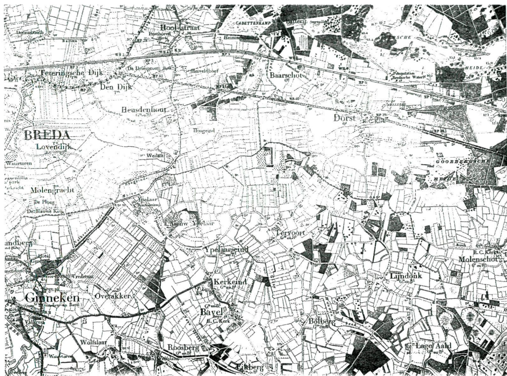
2. Enkele dorpsakkers in beeld op de Topografische en Militaire kaart (1868). Bij Dorst en Bavel zijn nog enkele open akkercomplexen te zien.

p. 250). Men kan zich natuurlijk afvragen hoe lang na het vertrek van de Romeinen de akkers in gebruik werden genomen (of waren ze in de Romeinse tijd al in gebruik?). Een ander toponiem dat op hoge leeftijd wijst is Tommel (van tumulus, grafheuvel), een lang niet zeldzame akker-naam in de Baronie. Deze grafheuvels kunnen uit de Bronstijd dateren, zoals die van het gehucht Tommelt onder Baarle-Nassau (Bauwens-Lesenne, 1965), maar vaker betreft het vondsten uit de Gallo-Romeinse periode. Waarschijnlijk hebben de grafheuvels oorspronkelijk buiten het cultuurland gelegen en zijn ze later door de bouwlanden ingesloten en tenslotte, nadat het ontzag voor deze plaatsen afgenomen was, ook ontgonnen.