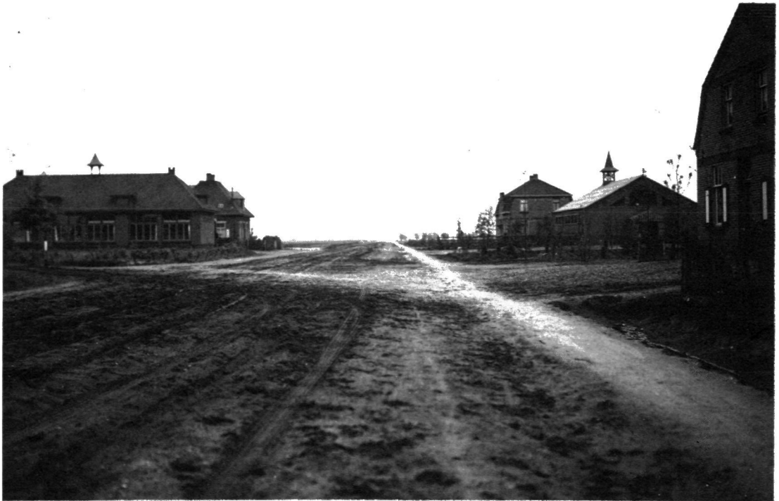
Figuur 2. Odiliapeel (gemeente Uden, Noord-Brabant), een dorp dat in de jaren '20 met rijkssteun op ontgonnen heidegrond werd gesticht. (Film- en fotoarchief van de Rijksvoorlichtingsdienst, foto-archief Heidemaaatschappij, negatief nr. 4722).

vond men dat de afhankelijkheid van import diende te verminderen. Een voor de hand liggende maatregel om dit te realiseren was het ontginnen van woeste gronden ter vergroting van het voedselvoortbrengend areaal. Om te onderzoeken hoe dit het beste zou kunnen gebeuren stelde de regering in 1919 de ‘Commissie van Advies inzake de Ontginning van Woeste Gronden’ in (Commissie Lovink). De commissie kreeg in de opdracht al de richting mee waarin ze het diende te zoeken: stichting van boerderijen van beperkte omvang ter vestiging van ‘een krachtige, onafhankelijke boerenstand’ 17 . Een zodanige doelstelling was mede geformuleerd onder invloed van de dominant geworden confessionele krachten in de