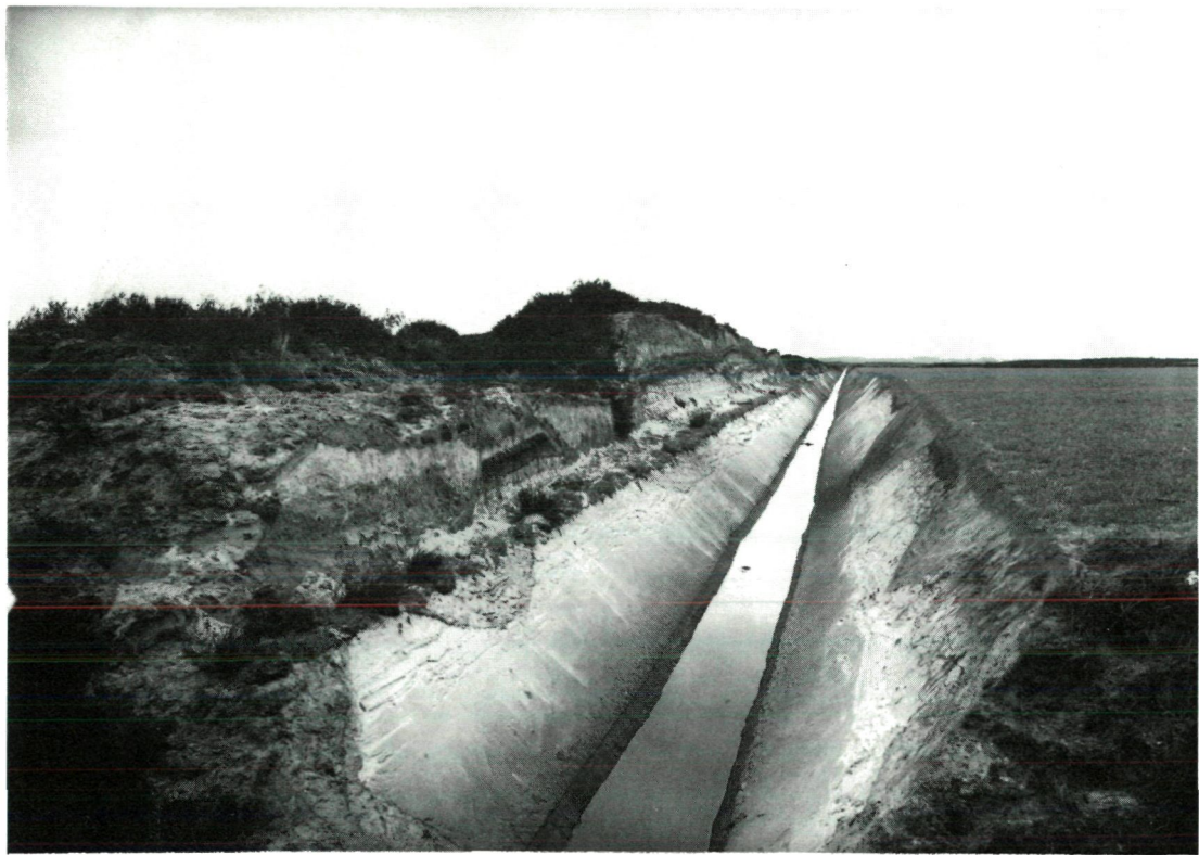
Figuur 3. Heide en – waarschijnlijk in werkverschaffing – ontgonnen gronden nabij Sellingerbeetze (gemeente Vlagtwedde, Groningen). (Film- en fotoarchief van de Rijksvoorlichtingsdienst, foto-archief Heide-maatschappij, negatief nr. 977).

Nederlandse politiek. Met name de Rooms-Katholieke Staatspartij wilde de kleinere boeren meer kansen geven. Advies van de commissie leidde ertoe, dat vanaf 1920 geld ter beschikking werd gesteld aan boeren en boerenzoons om een bedrijf op heidegrond te stichten van acht tot twaalf hectare groot. Deze regeling is vooral in de Peel toegepast. Onder meer de nederzettingen IJsselstein (gemeente Venray, Limburg), Odiliapeel (gemeente Uden, Noord-Brabant) en Jodenpeel (gemeente Bakel c.a., Noord-Brabant) zijn met behulp van deze regeling tot stand gekomen. De voorwaarden voor subsidieverlening waren tamelijk strikt: de kandidaten dienden een minimum aan eigen kapitaal te bezitten en bewezen