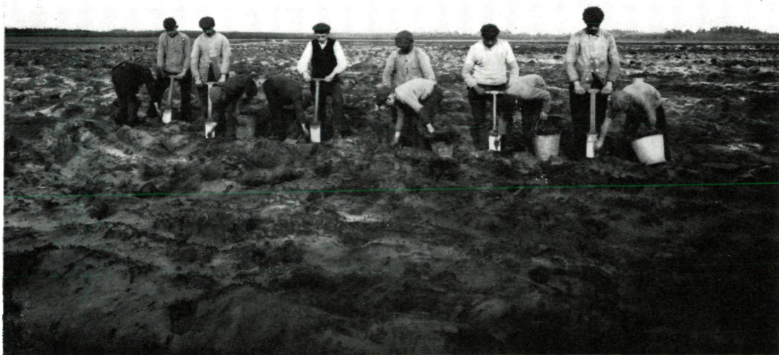
Figuur 1. Planten van dennen op heidegrond in het begin van deze eeuw.

taak wachtte. Na advisering vanuit verschillende hoeken greep de staat in 1897 voor het eerst direct in. Toen werden 2600 hectare heide en zand bij het gehucht Kootwijk in de gemeente Barneveld (Gelderland) aangekocht voor ontginning tot bos. In de voorafgaande jaren was al wat bebost op domeingronden, maar dat was in de duinen (op Texel en bij Schoorl) en op heidegronden (rond Breda) die al eerder in het bezit van de staat waren. De verwerving bij Kootwijk was de eerste van een lange reeks aankopen van heidevelden. De grote boswachterijen op de Veluwe en in Drenthe zouden hierop ontstaan. In 1899 vond de regering dat voor het uitvoeren van de nieuwe taak ook een nieuw orgaan in het leven geroepen moest worden. Bij begrotingswet besloot