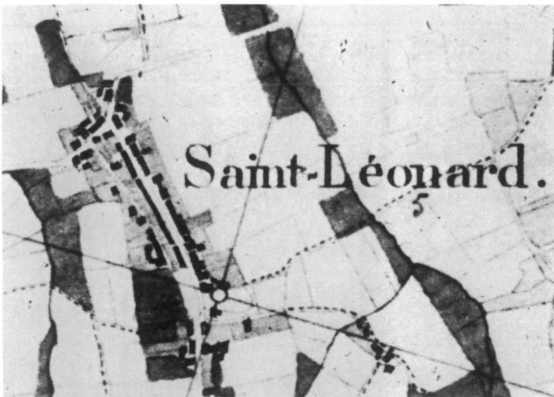
Figuur 3. Sint-Lenaarts in 1852 (het noorden is boven). Nationaal Geografisch Instituut Brussel, Kadastrale overzichtskaart nr. 104bis. Fragment; foto K. Leenders naar een door prof. H. van der Haegen te Leuven beschikbaar gestelde dia.