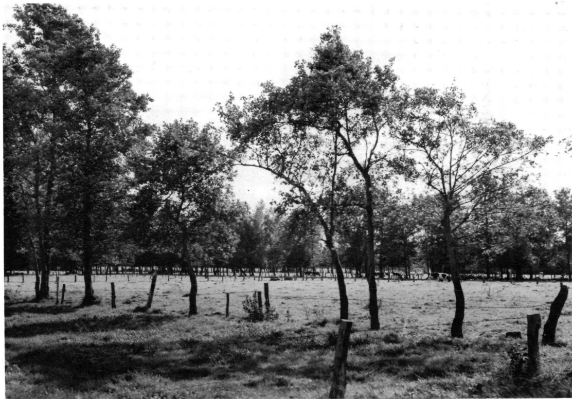
Landschap ten noorden van Stobbelaar (bij Hallerhoek). Om de laaggelegen graslandpercelen zijn elzen aangeplant.

De inrichting van het landschap is niet op de moderne eisen berekend. Aanpassing werd noodzakelijk geacht. Beide kaartfragmenten maken dan ook deel uit van gebieden waarin ruilverkaveling plaatsvindt.