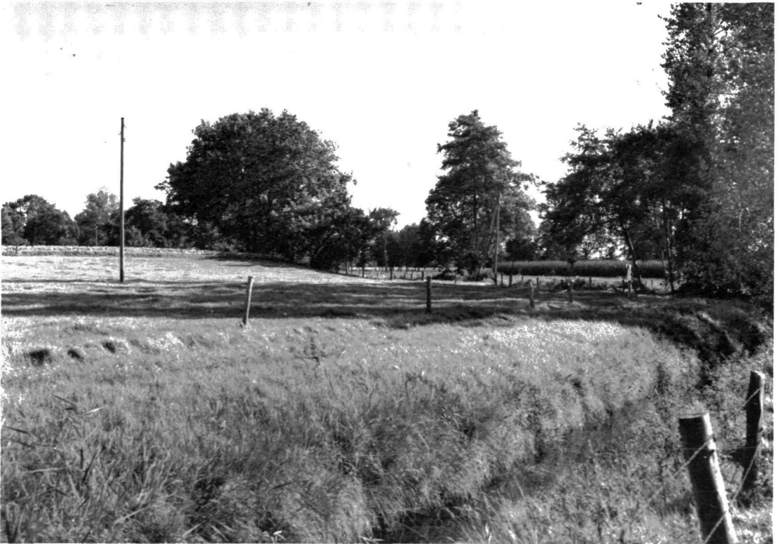
Landschapstype met kleine, verspreid liggende akkertjes of “kampen”, die veelal metr loofhout omzoomd zijn.