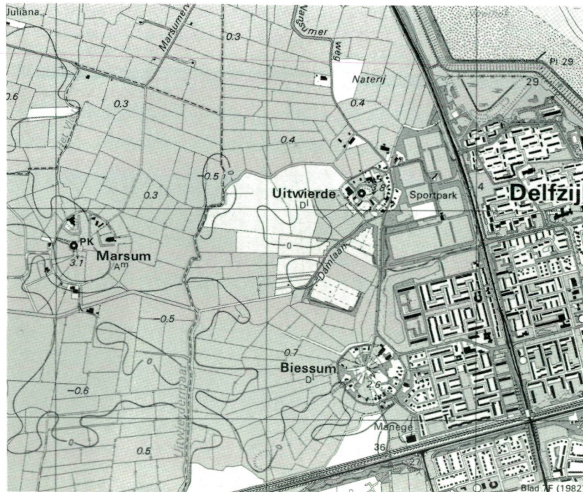
Oudere zeekleipolder (terpdorp in zeekleilandschap), met onregelmatige blokvormige percelering en geconcentreerde bebouwing, vaak op terpen.

Rond het begin van de jaartelling vestigden de eerste bewoners zich langs de relatief hooggelegen boorden van de natuurlijke waterloop die vanuit het Schildmeer via Delfzijl in de Eems uitmondde. De wierden van Biessum en Ringum (op de kaart het met schrapjes aangegeven rondje ten westen van Biessum) moeten in de onmiddellijke nabijheid van deze waterloop hebben gelegen. Later werd de zogeheten knipklei — in Groningen knikklei genoemd — afgezet. Knikklei is een zware, compacte zee-