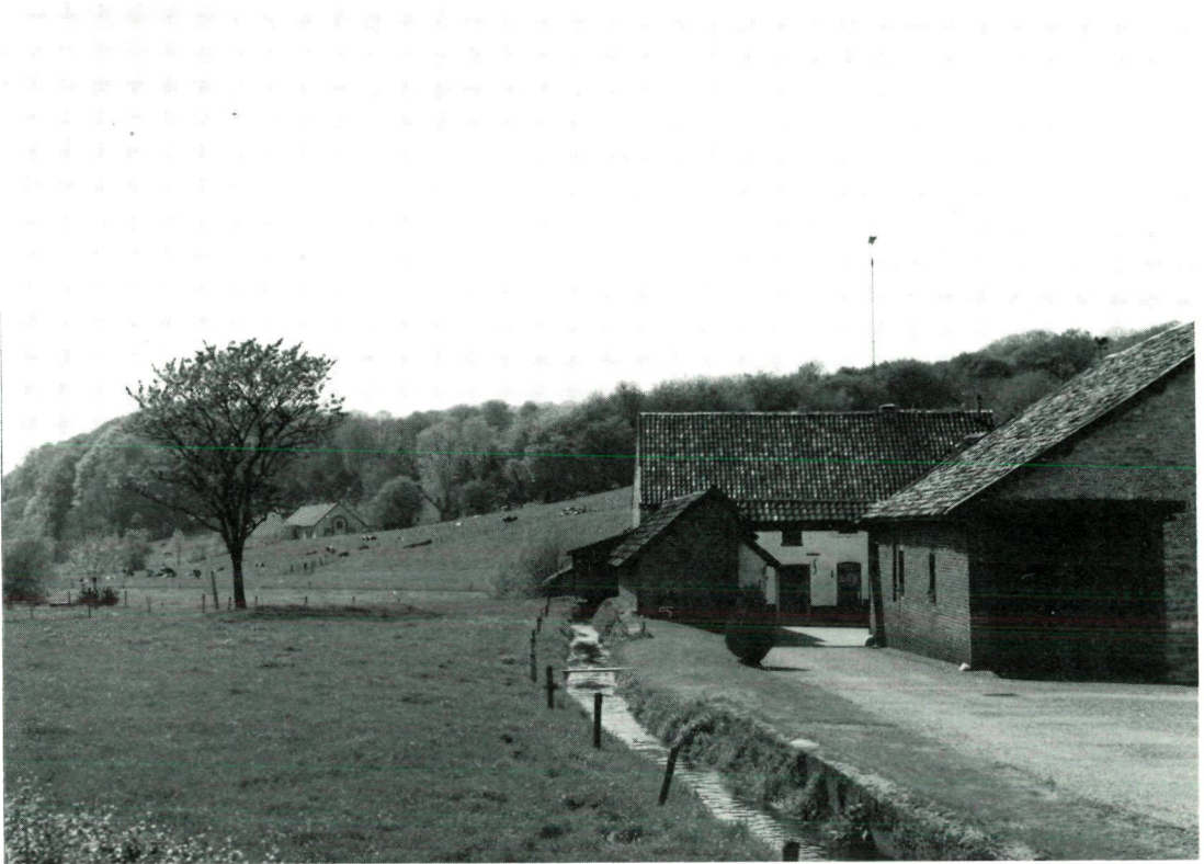
Het dal van de Eyserbeek met op de voorgrond de Bulkemsmolen met de molenbeek. Op de achtergrond zijn boederij Vogelzang en de beboste helling naar het plateau te zien.

en grootste van het kaartfragment. Eys bestond al in de vroege middeleeuwen. Mogelijk geldt dat ook voor Overeys. Beide dorpen bestaan uit twee delen: een grote boerderij of een landgoed, en een dorpskern. Aan de westzijde van Eys ligt de Eyserhof; de kern van een grootgrondbezit dat zich langs beide oevers van de beek uitstrekt. De hof ligt zoals gezegd op de meest gunstige plek. Ten oosten van de hof ligt het dorp, met het zeer versnipperde grondbezit op de Boerenberg (het plateau ten noordoosten van het dorp). Overigens stuiten we hier op een van de grootste beperkingen van de Nederlandse topografische kaarten: het verkavelingspatroon op de open akkergebieden is niet aangegeven.