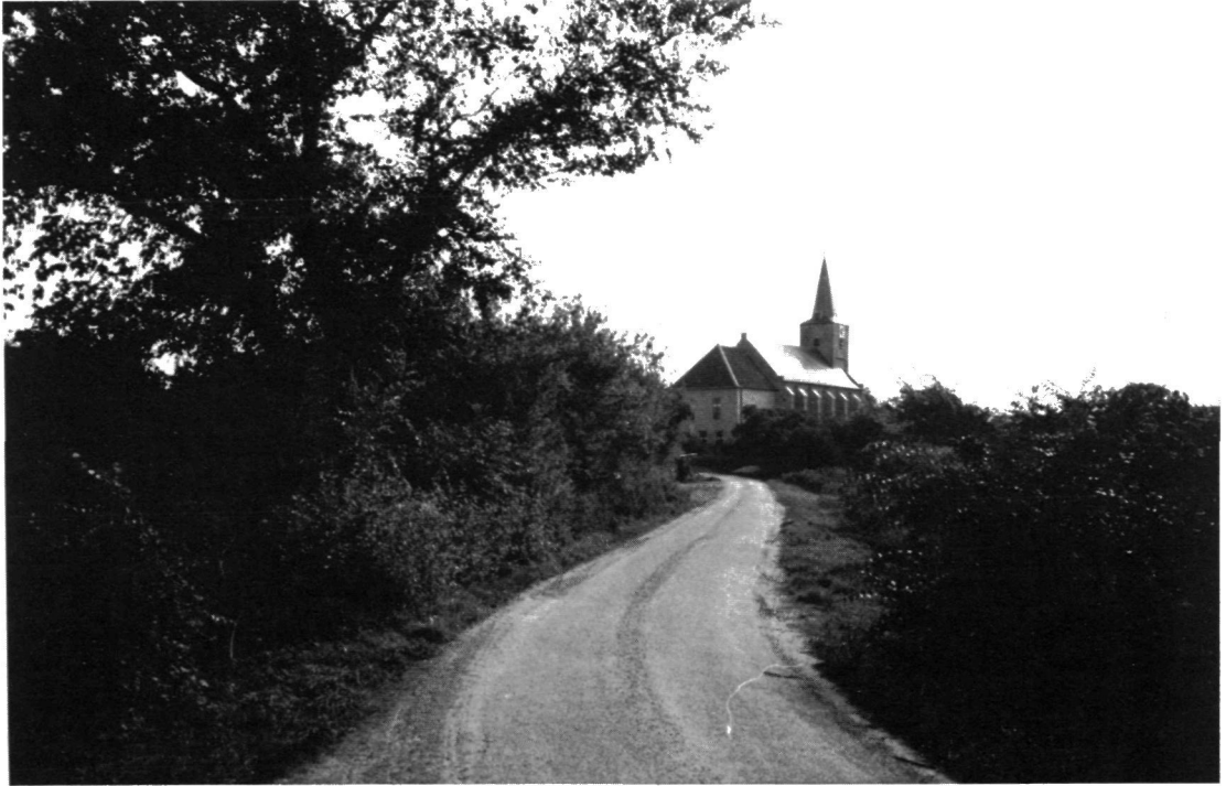
De middeleeuwse kerk van Erichem, hoog op de stroomrug. Het weggetje dat vanaf het akkercomplex De Hooge Korn naar het dorp leidt, wordt omzoomd door een gevarieerde begroeiing.

daarvan staat de middeleeuwse kerk op een terp.