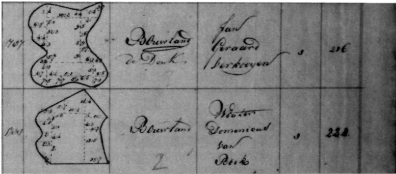
Figuur 4. Enkele merkwaardig gevormde percelen uit een maatboek van Zundert. Vooral in vroegontgonnen gebieden treft men allerlei onregelmatig uitzienende stukken grond aan. Gem.archief Zundert (berustende te Zevenbergen) nr. 512, f. 151 uit het jaar 1808.

ken grond; zo vinden we in 1750 een perceel 'den Driehoek' te Gilze 62 en in 1524 op Den Hout 'dat driehoekvelt' 63 . Recent zijn aanduidingen als Tip en Punt.