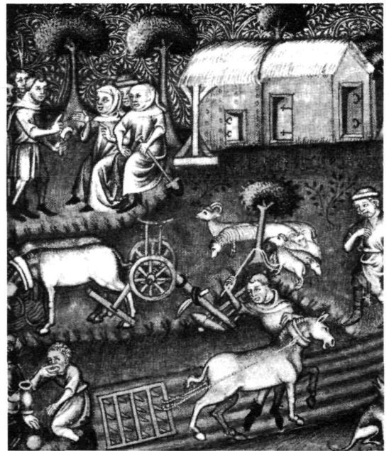
Figuur 2. Afbeelding uit N. Oresme: Politiques en économique d'Aristote , 1372. Kon. Bibl. Albert I te Brussel. We zien spitten, ploegen en eggen. Naar een afbeelding in Roger Linskens: Wat een leven , deel 5.

den, rouwe velden etc. Zuur was ook al geen lovend adjectief. Beemden lagen vaak op zure gronden. Te Zundert vinden we in 1683 'den sueren beemt' 12 ; in diezelfde plaats lagen ook: De Zurendonk, De Zuurweide en Het Zuurveld. Grofzandige akkers konden in het vroege voorjaar makkelijk gaan verstuiven. In de Baronie liggen twee nederzettingen met de naam Stuivezand, nl. bij Zundert en bij Oosterhout. Verder komt Stuift als akker-naam verspreid voor, bv. te Lijndonk in 1527 'de Stuyft' 12 en te Wernhout in 1471 eveneens 'de Stuyft' 13 . Daarnaast kende men 'vliegende zanden' en zelfs 'vliegende vennen'. Zo wordt een stuk grond te Rijen in 1425 aan de geburen gemeenschappelijk uitgegeven en onder hen verdeeld, omdat 'het hen groote scade begonst te