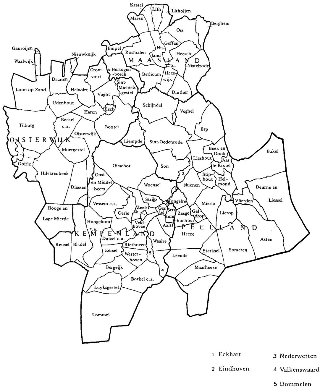
Figuur 1. De meierij van Den Bosch; indeling in kwartieren.