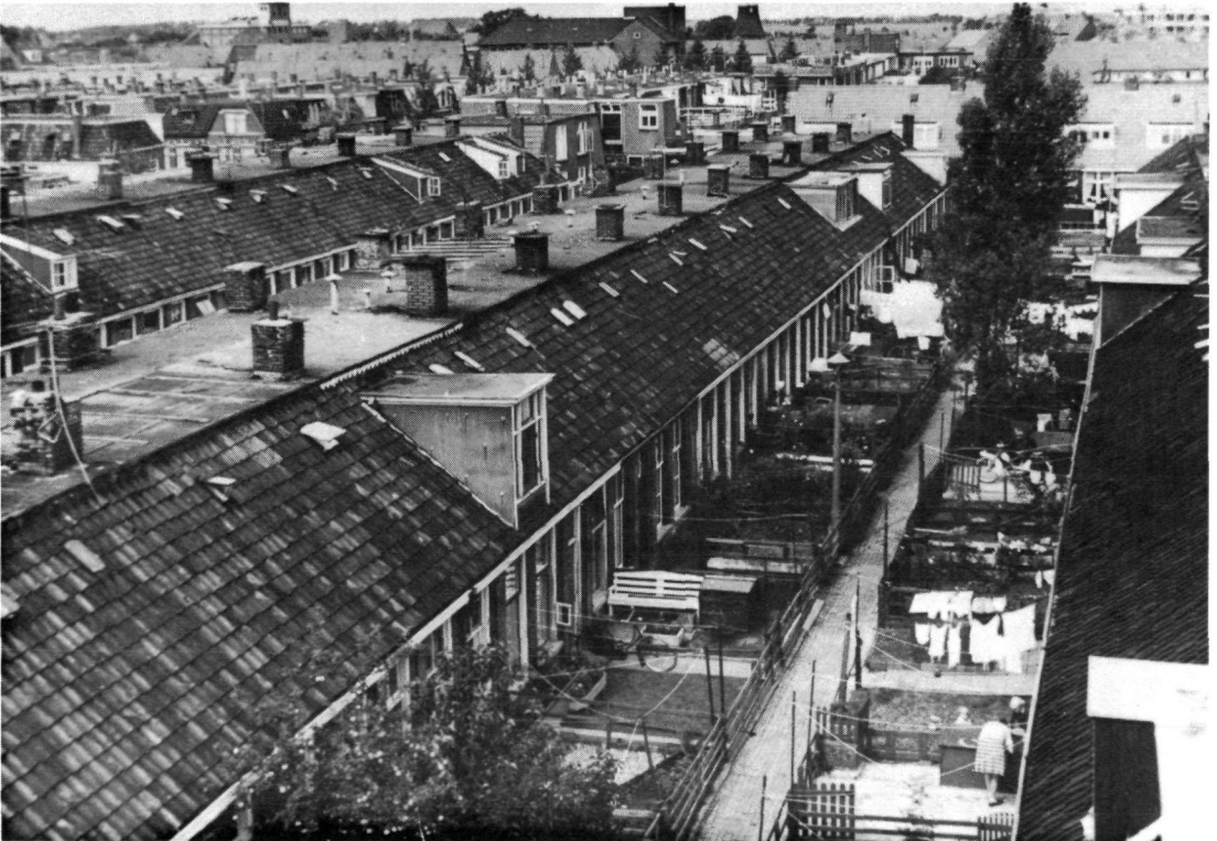
Figuur 5. Werkmanslust aan het begin van de jaren zestig

resteert op dit ogenblik weinig meer, ze zijn bijna alle ten prooi gevallen aan de slopershamer. Deze rekende meedogenloos af met een negentiende eeuwse erfenis welke tot ver in onze eeuw als krot in de woningstatistieken terug te vinden was. Daarmee verdween een karakteristiek stuk Leeuwarden. Met het plan Oost begon omstreeks 1900 voor Leeuwarden een nieuw tijdperk van krachtige ruimtelijke groei en bevolkingsaanwas. De in het kader van de Woningwet opgerichte woningcorporaties pakken vanaf 1908 de draad op, waar de negentiende eeuwse al dan niet door ideeële motieven beïnvloedde bouwers die hebben achtergelaten. Hun 20e eeuwse activiteiten behoren echter tot een ander hoofdstuk.