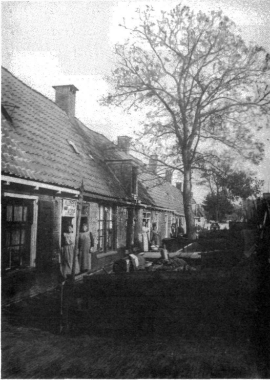
Figuur 2. De Weerklank, de oudste Leeuwarder Volksbuurt buiten de grachten

Er zijn meer signalen die er op duiden dat de woningnood meer kwalitatief dan kwantitatief van karakter was. Nergens in Nederland daalde tijdens de hier beschreven periode de huwelijksleeftijd zo langzaam als in Friesland. Van alle provincies was de Friese huwelijksfrequentie al in 1859 het hoogst, de huwelijksleeftijd navenant gemiddeld het laagst.