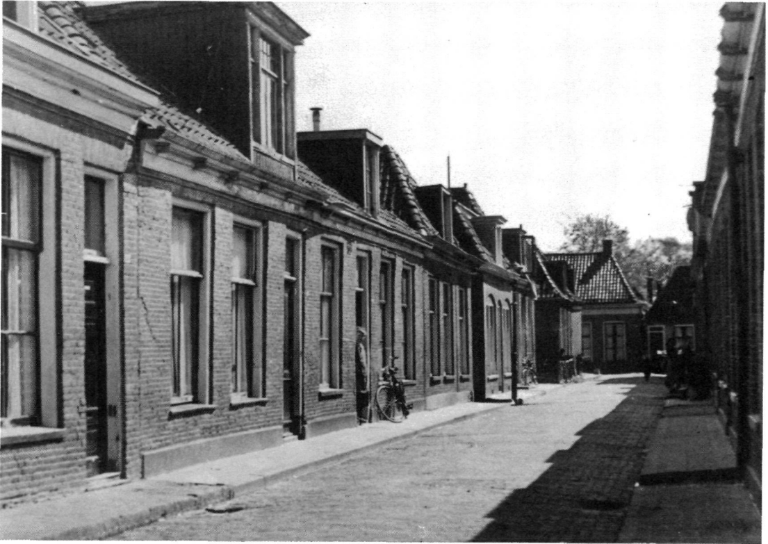
Figuur 4. Het IJsaankwartier in de jaren vijftig (gemeentearchief Leeuwarden).

gen dat al aan het begin van de vorige eeuw buiten de stadsgrachten woonde. Dat sloot aan bij een ambachtelijk-industriële decentralisatie die er toe leidde dat al in een vroeg stadium vele bedrijvigheden zich om ruimtelijke, vervoers-technische (vaarwater), juridisch-fiscale (gilden, stedelijke belastingen) overwegingen -al dan niet in samenhang met veroorzaakte hinder- buiten de stad langs de voornaamste uitvals(vaar-)wegen vestigden. Ook ten zuiden van de spoorlijn Leeuwarden-Groningen in de gemeente Leeuwarderadeel (waarvan het zuidelijk deel plus de dorpen Lekkum en Miedum in 1944 bij Leeuwarden werd gevoegd) ontstond lintvormige bebouwing langs de Overijsselse Straatweg (Schrans). De verdere groei sloot zich hierbij aan. Tot 1865 was die groei gestaag, daarna -vooral in de periode 1870-1880- werd er veel gebouwd.