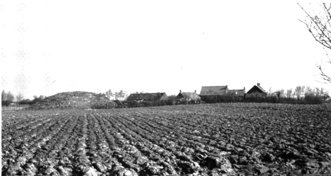
Figuur 2. Het gehucht Krommenhoeke. De vliedberg is vermoedelijk de in de overloper van 1585 genoemde "Sapapenhil" (zie figuur 1).

Met " begonnen van westen inne " geeft aan waar de boekhouder start; vervolgens werden de percelen afgelopen in de desbetreffende veldhoek. Dit ommelopen of overlopen heeft de overlopers wellicht hun naam gegeven. Behalve landschappelijke elementen bevatten de veldhoek-beschrijvingen ook toponiemen en soms hebben de hoeken zelf een naam. De hoeken komen in de overlopers in dezelfde volgorde en genummerd voor. De veldhoeken staan in enkele gevallen op (gereconstrueerde) kaarten. Helaas is hiervan geen index. Het historisch-geografisch belang van de veldhoeken lijkt me niet te hoeven worden toegelicht.